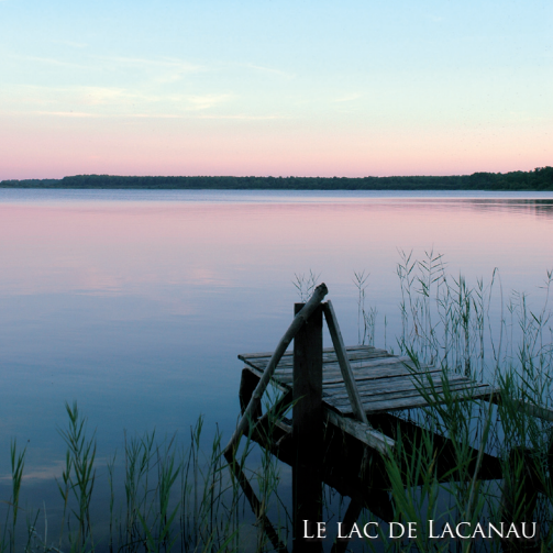
LE LAC DE LACANAU