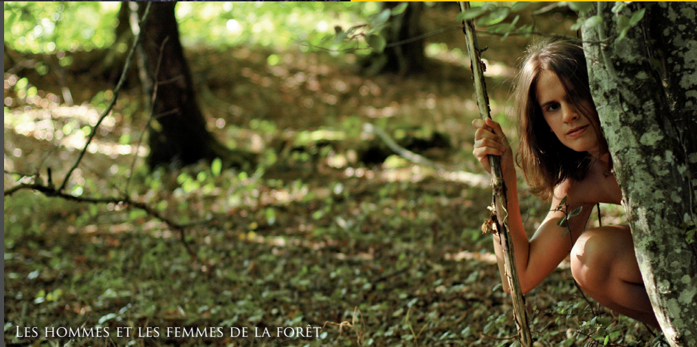
LES HOMMES ET LES FEMMES DE LA FORÊT