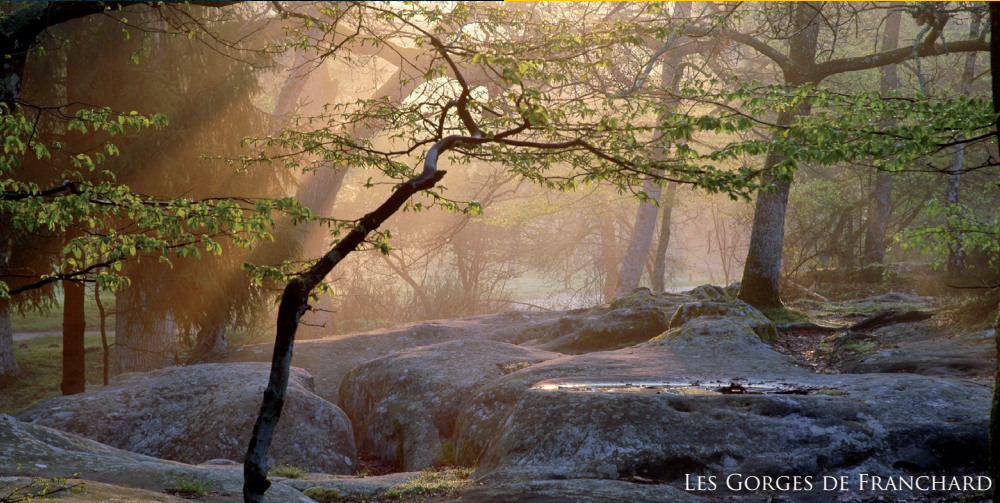
LES GORGES DE FRANCHARD